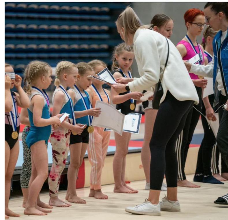
Kuva: Tomi Mäkipää